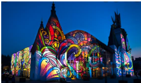
SLIKA 5: GLEDALIŠKA IN KONCERTNA DVORANA S POSLIKAVO

Dvorana, kateri domačini rečejo kar kulturni dom, s svojo nenavadno zunanjo podobo pritegne pozornost mimoidočih. Zaradi izjemne arhitekture in ambienta je prepoznavna v širšem okolju in je vredna ogleda (Visit Pomurje, b. d.).