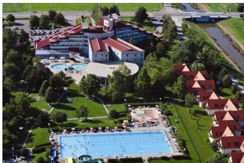
SLIKA 3: TERME LENDAVA

Ko bodo naše terme ponovno zaživele, saj so trenutno zaradi prenove zaprte, boste našo rekreativno krožno pot lahko še popestrili in jo še lepše zaključili. Lahko se boste prepustili razvajanju v zdravilni termalni vodi in sprostili telo v svetu savn. Privoščite si lahko tudi vodno doživetje z nočnim kopanjem.