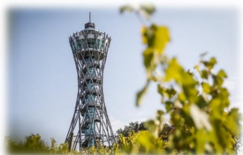
SLIKA 7: STOLP VINARIUM

Z dvorišča kapelice se odpira širni razgled na pomursko ravnico, hrvaško gričevje in madžarsko ravnico. Ob lepem vremenu se pa v daljavi lesketa tudi avstrijsko gorovje. Skratka z ene točke lahko vidimo kar štiri države (Wikipedia, b. d.).