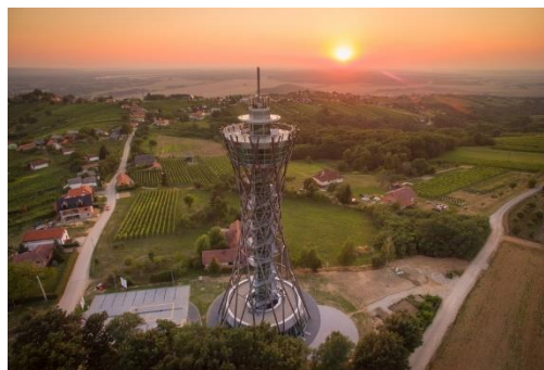
SLIKA 2: STOLP VINARIUM OB SONČNEM ZAHODU

v Lendavskih goricah, vam priporočamo opazovanje sončnega zahoda , ki je prava paša za oči in hrana za dušo. V kolikor pa se boste vrnili v Lendavo in prespali v mestu, pa vam priporočamo večerno okrepčilo v Gostilni Lovski dom , kjer vas bodo razvajali z domačo pripravljeno lokalno hrano.