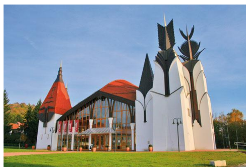
SLIKA 1: GLEDALIŠKA IN KONCERTNA DVORANA

Iz Petišovskega gozda se boste s kolesi odpravili proti Lendavi. Ustavili se boste v Piceriji Popaj (opcijsko) in se okrepčali. Od tu boste pot nadaljevali proti Gledališki in koncertni dvorani ter si поблиžje ogledali to čudovito zgradbo. Nasproti omenjene dvorane se bohoti Sinagoga , ki si jo boste prav tako поблиžje ogledali in spoznali.