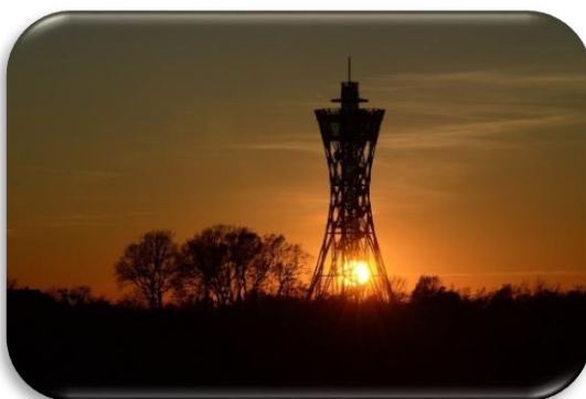
SLIKA 8: STOLP VINARIUM IN SONČNI ZAHOD

Razvajate pa se še lahko ob opazovanju na osupljiv sončni zahod.